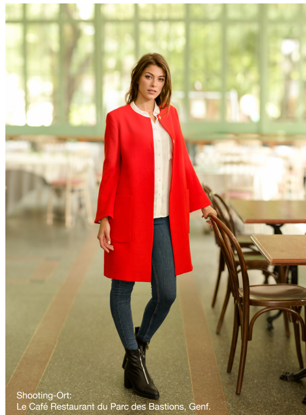
Shooting-Ort: Le Café Restaurant du Parc des Bastions, Genf.

Je nach Version bieten diese Modelle 50, 100 oder 200 schöne Stiche mit 7 mm Stichbreite an. Darin enthalten sind drei, sieben oder zwölf Knopflochvarianten. Diese Ein-Stufen-Knopflöcher werden automatisch in einem Arbeitsgang genäht. Ob dekorativer Zierstich oder praktischer Nutstich, Sie werden von der Präzision und Gleichmäßigkeit des Stichbildes begeistert sein. Bei Modell 570 können Sie Ihre individuellen, einzigartigen Stichfolgen speichern.