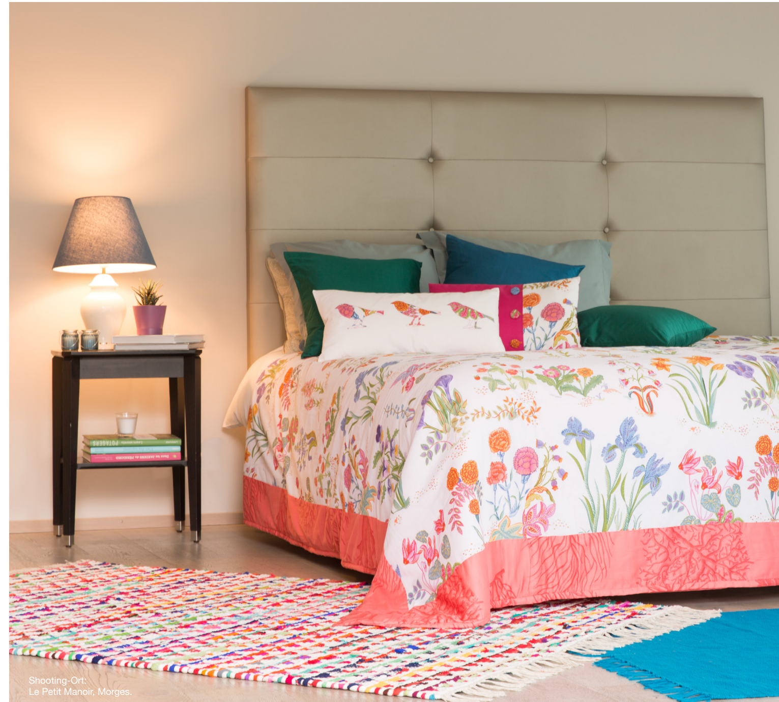
Shooting-Ort: Le Petit Manoir, Morges.

Viele praktische Funktionen machen Ihre Nähaufgaben leichter, schneller, angenehmer.