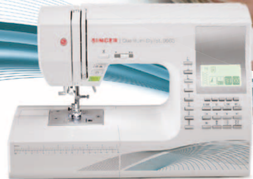
Quantum Stylist™ 9960