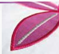
Tapering für mehr Variation beim Nähen.

Tapering – Mit allen 9-mm dekorativen Zierstichen. Nähen Sie Ihren Stich am Anfang und/oder Ende spitz zulaufend. Der Winkel der auslaufenden Stiche kann darüber hinaus noch verändert werden, für einen individuellen Look.