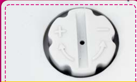
Nähfußdruck: Der Nähfußdruck kann entsprechend dem Material für ein exaktes Nähergebnis eingestellt werden. Gerade bei sehr dehnbaren Stoffen kann dies von Vorteil sein. Das Dehnen der Stoffe wird verhindert.