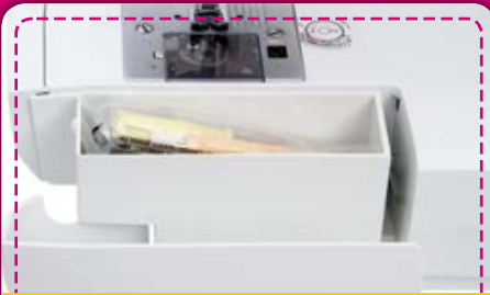
Zubehörfach: Finden Sie in der praktischen Zubehörbox alles Wichtige zu Ihrer Juki Maschine, einfach verstaut und kompakt.