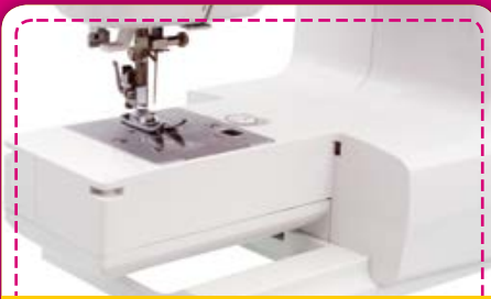
Freiarm: Nähen von geschlossenen Rundungen – Kein Problem!