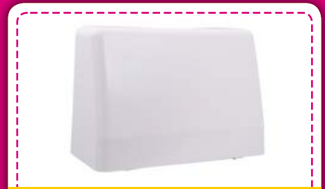
Robuste Kofferhaube: Sie schützt Ihre JUKI Nähmaschine vor Staub und Verschmutzung.