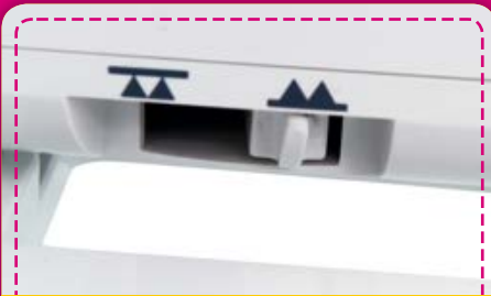
Transporteur-Versenkung: Nur durch Schieben des Transporteurschiebers können Sie Freihandquiltstiche oder Stickereien einfach nähen.