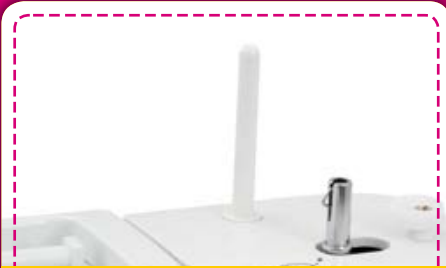
Zusatzfadenständer: Wenn Sie mit einer Zwillingnadel arbeiten wollen, brauchen Sie einen zweiten Nadelfaden. Wohin damit? Ganz einfach! Die Fadenskone auf den zusätzlichen Fadenständer aufstecken, einfädeln und los.