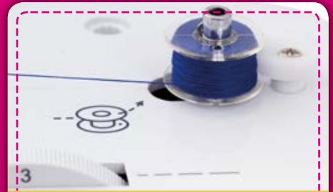
Spuler: Setzen Sie die leere Unterfadenspule auf den Spulerstift auf, Faden einlegen und einfach mit dem Aufspulen beginnen.