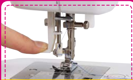
Nadeleinfädler: Der automatische Nadeleinfädler fädelt die Nadel ganz einfach ein. Sie können ganz schnell mit dem Nähen beginnen.