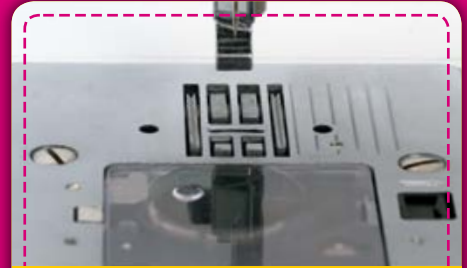
Transporteur: Dank zusätzlichen Transportzähnen vor der Nadel verfügt Ihre Juki über einen starken Stofftransport von Nähbeginn an. Projekte mit schweren bis leichten Stoffen lassen sich somit sehr gut transportieren und nähen.