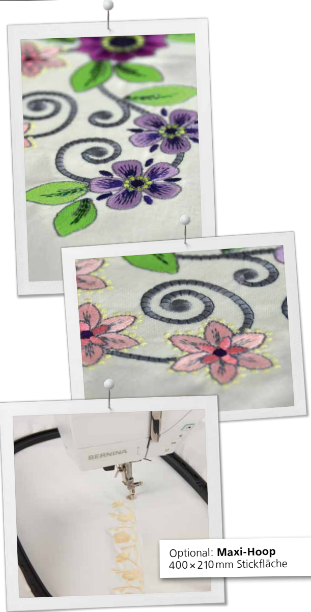
Optional: Maxi-Hoop 400 x 210 mm Stickfläche