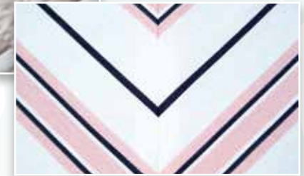
Das Original IDT™-SYSTEM - Zusammennähen geht einfach nicht perfekter!