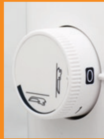
Regler für Materialdicke