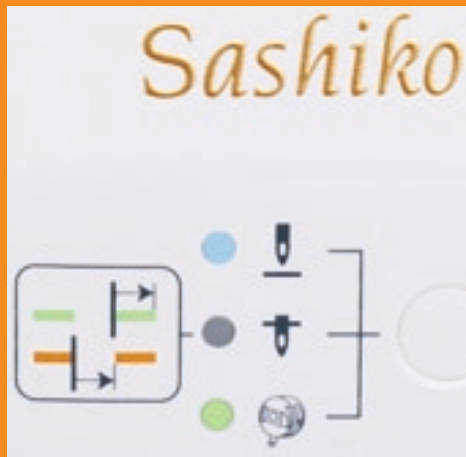
Funktionstaste für Nadel Hoch-/Tiefposition