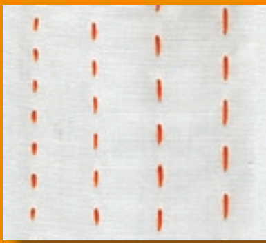
Stichoption gleicher Stichabstand, variable Stichlänge zwischen 2 und 5 mm