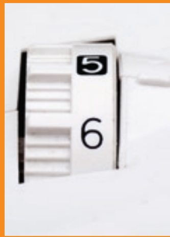
Nähfußdruckeinstellung mit Anzeige