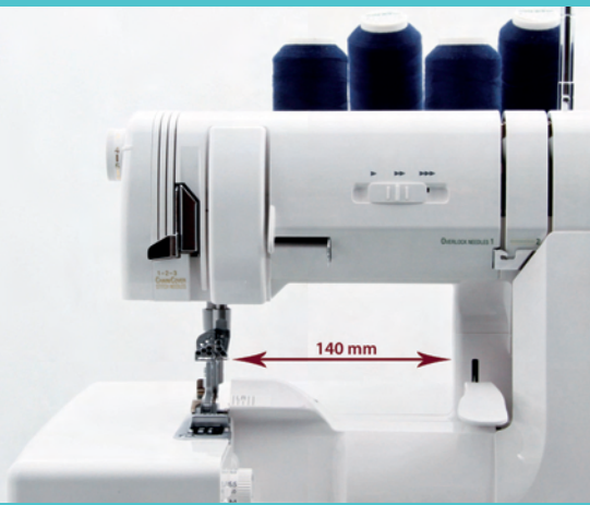
Geschwindigkeitsregelung und extra breiter Durchlass