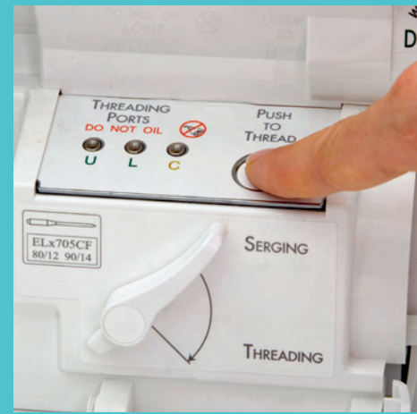
Jet-Air-Greifereinfädelsystem. Einfach genial!!!