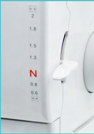
Differentialtransport für optimale Nähergebnisse