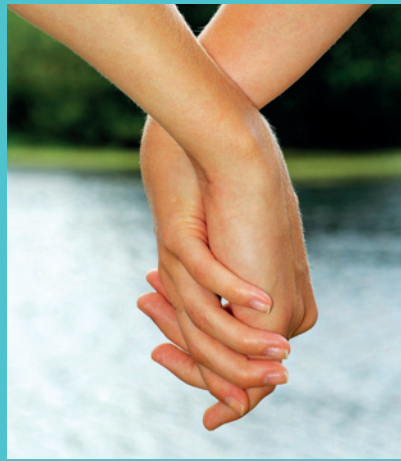
... einzigartige Verbindung.