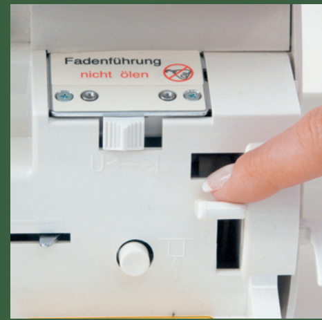
Jet-Air-Greifereinfädelsystem. Einfach genial!!!