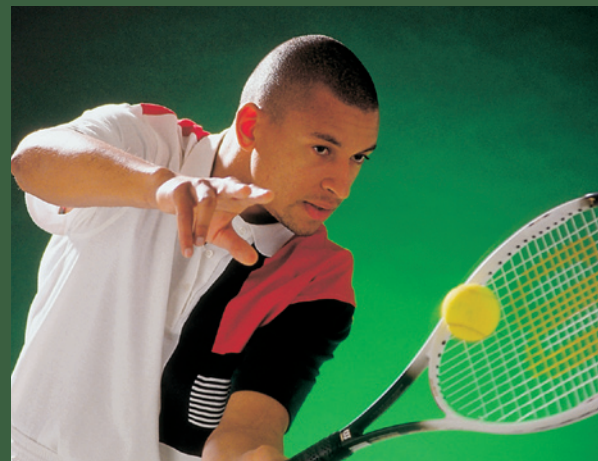
... wir wecken den Profi in Ihnen.