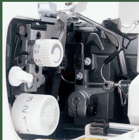
übersichtliche Anordnung der Einstellknöpfe