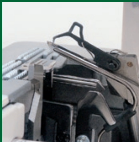
extrastarke Greifer mit schwenkbarem Hilfsgreifer