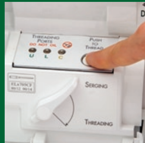
Jet-Air-Greifereinfädelsystem. Einfach genial!!!

evolution... Niveauvolle Technik, damit Sie nähen wie ein Profi.