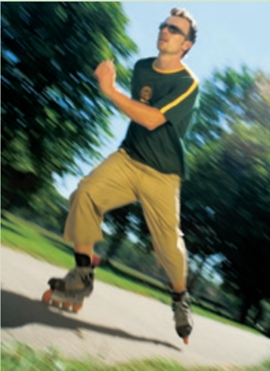
... bringt Bewegung.

Selbstverständlich ist die Maschine mit hochwertiger Technik, wie dem ATD-System, dem unentbehrlichen Jet-Air-Einfädelsystem und vielen weiteren technischen Raffinessen ausgestattet.