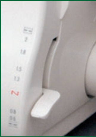
Differentialtransport für optimale Nähergebnisse