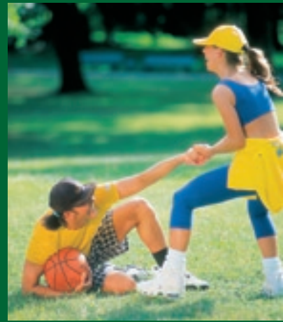
... mehr als nur verbinden.