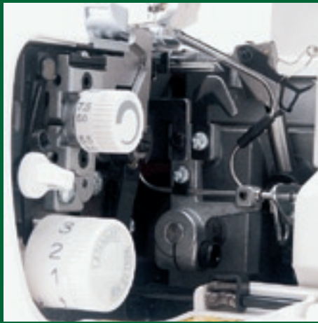
übersichtliche Anordnung der Einstellknöpfe